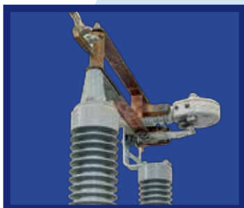
Seccionador modelo Alduti-Rupter 33 kV