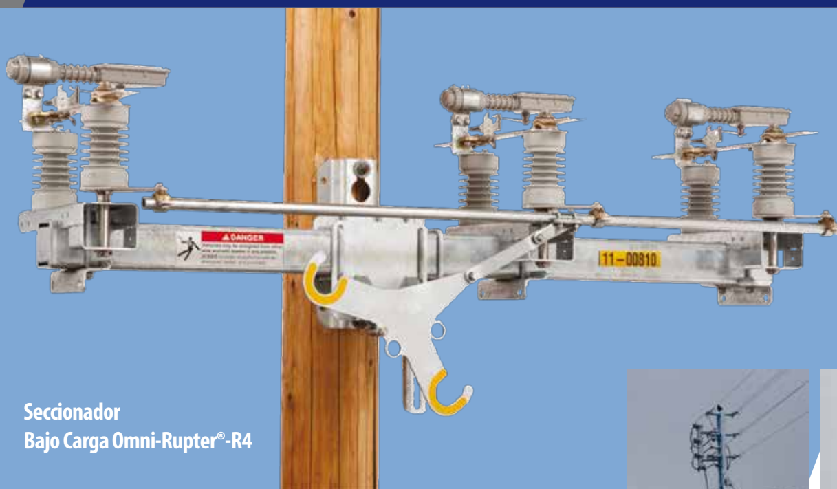
Seccionador Bajo Carga Omni-Rupter®-R4

Confiable en todos los climas. Rápida velocidad de accionamiento.